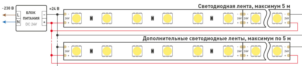
Схема 2. Подключение нескольких светодиодных лент с двух сторон.

Рекомендуется использовать для обеспечения равномерного свечения ленты по всей длине.