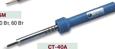
CT-40A 40 Вт