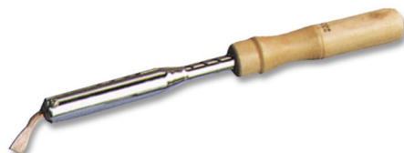
W421(TLW) 40 Вт, 50 Вт