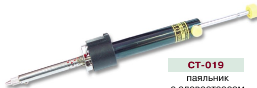
CT-019 паяльник с оловоотсосом 30 Вт