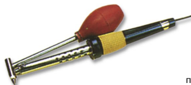
SC-40 паяльник с отсосом 40 Вт