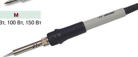
CT-922 паяльник с керамическим нагревательным элементом