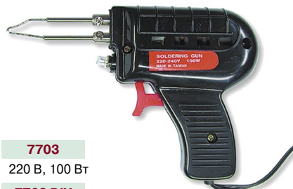
7703 220 В, 100 Вт 7703 DIY 220 В, 100 Вт