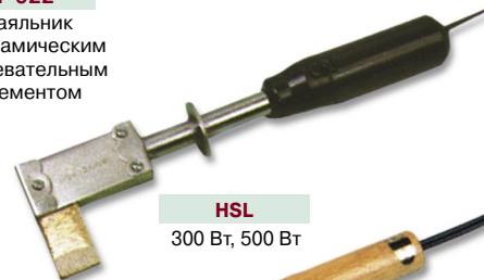
HSL 300 Вт, 500 Вт