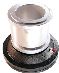
RP-6 паяльная ванна 250 – 300 Вт (320°C – 420°C)