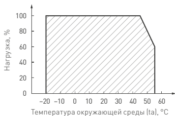
Рис. 3. Максимальная допустимая нагрузка, % от мощности источника